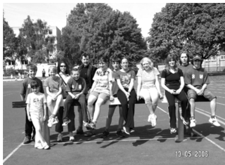
Atletika, župní přebor 2006

TJ Sokol Čelechovice na Hané má v obci dlouholetou tradici a to nejen v organizaci tělesné výchovy a sportu, ale u nás v obci zejména v oblasti společensko-kulturní, spočívající v zapojení obyvatel do života v Čelechovicích. Proto si Sokol klade za své poslání především poskytnout široké vyžití a zábavu všem bez rozdílu věku, kteří v naší obci žijí a zapojit je do našeho sportovně-společenského dění. A je přitom jedno, jde-li o sportovní utkání nebo společenskou akci. Důležité pro nás je, aby naše organizace přispěla ke zdravému životnímu stylu v Čelechovicích. Aktivně a systematicky pracujeme také s mládeží.