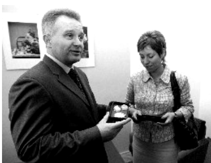
Hejtman převzal drobný dárek.

Hejtman Olomouckého kraje Ivan Kosatík se rozhodl několikrát do roka navštívit některou z menších obcí regionu a lépe poznat její problémy. Napoprvé padla volba na Čelechovice.