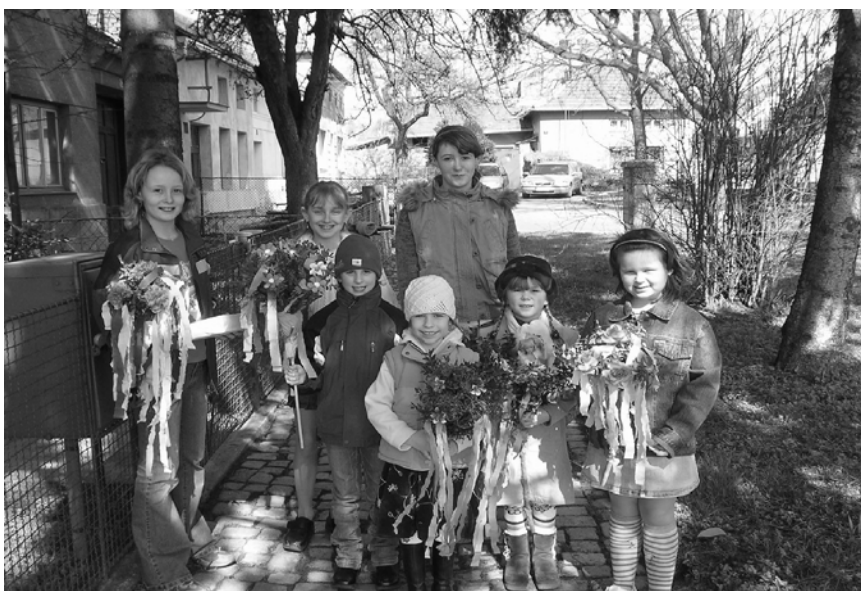
Na Kapli se na Smrtnou neděli chodilo s májem