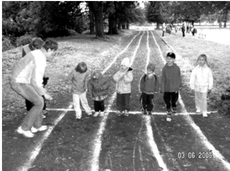
Sportovní dopoledne - Dětský den 2006

v naší obci 236 obyvatel. Cvičíme pravidelně každý den, včetně sobot a nedělí, podle rozpisu cvičebních hodin a podle chuti a fyzické zdatnosti cvičenců. Přijďte si vybrat! Přijďte se podívat! Naši jednotlivci i družstva se účastní množství turnajů a soutěží. Závodíme na cizích i na vlastních sportovištích, a můžeme se pochlubit řadou předních umístění v žebříčku hodnocení. K tomu všemu pořádáme nebo spolupřádáme i akce jako je Dětský karneval, Zimní putování z Čelechovic do Čelechovic přes vrchol Kosíře, Aprílový koncert, Dětský den, Zahradní slavnost apod. Mezi ty nejzdařilejší akce tohoto