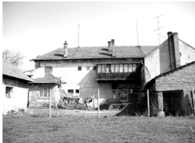
Dům č. p. 39, Studenec